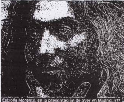
Estrella Morente, en la presentación de Oyer en Madrid.